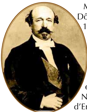
Portrait du duc de Morny

Morny, député du Puy-de-Dôme, participait dans les années 1840/1850 à des courses qu'organisaient à Moulins, où le jeune baron disposait d'un hôtel particulier, des officiers en garnison dans l'importante caserne de cavalerie de la ville et en particulier un certain Édouard Ney, un des fils du maréchal d'Empire. Morny aida, ainsi que le préfet de l'Allier Maupas, le jeune baron, amoureux fou des chevaux, à créer l'hippodrome de Moulins où les premières courses se déroulèrent dès 1852. Puis il le lança dans l'aventure politique en lui obtenant la candidature officielle. Nul doute que le baron, inquiet de la persistance des idées républicaines et de l'opposition populaire manifestée à la prise du pouvoir de l'Empereur, franchit le pas facilement, rompant avec l'aristocratie légitimiste. De plus, il était féru d'économie, proche des milieux saint-simoniens, et persuadé que la vieille noblesse ne se sauverait qu'en participant à la révolution économique que prônaient l'Empereur et son entourage, alors que la noblesse bourbonnaise se montrait timorée, voire hostile au développement industriel. Ce libéral pensait également que l'amélioration du niveau de vie qui en résulterait pour les classes populaires serait un rempart efficace contre la diffusion des idées républicaines toujours pérennes.