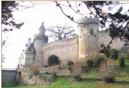
Le château de Veauce

acte privé sous blanc-seing signé de Morny et de Cadier où ils s'associaient pour faire exploiter une carrière de kaolin proche d'Ébreuil, Morny fournissant même les premiers fonds avant de s'en désintéresser assez vite. Morny, autour des années 1854, faisait construire un château et une ferme modèle à 10 km du château du baron. Pendant les deux années que durèrent les constructions, chaque fois qu'il descendait en Auvergne, il logeait chez son ami le baron au château de Veauce ; ils chassaient ensemble également. L'exploitation des