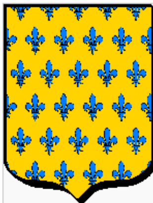
Blason de la famille d'Apchon

C'est dans ce contexte qu'intervint l'assassinat d'un jeune noble Bourbonnais, rejeton d'une des familles les plus puissantes de la province. Au début du mois de septembre 1566, Guillaume d'Apchon, jeune écuyer du duc d'Anjou et homme d'armes du comte de Montpensier, mourait assassiné sur les terres du vicomte d'Aubeterre en Saintonge. Le vicomte, François Bouchard, un parpaillot, avait commandité le meurtre. Aussitôt la nouvelle parvenue aux oreilles de Marguerite d'Albon, la mère de la victime, celle-ci prit la tête d'une vendetta qui, par bien des aspects, s'apparentait à la faide médiévale 1 .