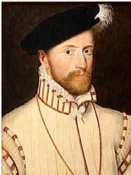
Portrait de Jacques d'Albon