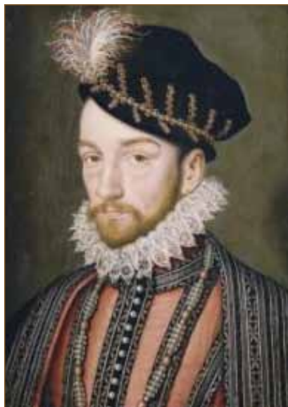
Portrait du roi Charles IX

provinciale pour défendre son honneur et son sang. Elle permet également d'aborder la question du devoir de piété que chacun d'eux entretenait avec les siens. S'appuyant sur une parentèle nombreuse et puissante, la mère éplorée organisa minutieusement la vengeance en intervenant à tous les niveaux de pouvoirs, du plus bas échelon local à celui de la reine-mère, au sommet de l'État. Cette vendetta lignagère, tout comme le meurtre, banal en apparence, s'insérait en fait tant dans le cadre des violences entre catholiques et protestants que dans